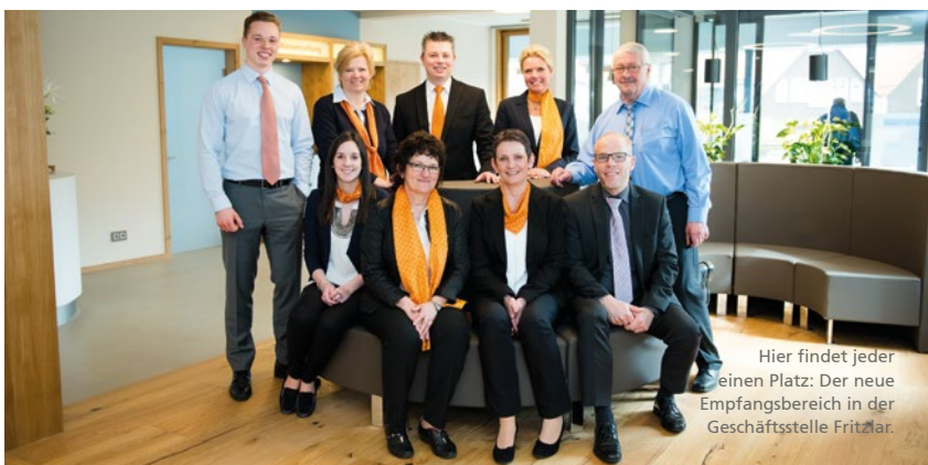
Hier findet jeder einen Platz: Der neue Empfangsbereich in der Geschäftsstelle Fritzlär.

Die persönliche Nähe zu den Kunden ist der entscheidende Vorteil der regionalen VR-Bank. Daher wurde viel Wert auf eine gute Atmosphäre gelegt, die sich auch in der Wahl der Farben und Materialien widerspiegelt: Eichenholz und Glas, weiß und grau dominieren das neue Design. Im Kaffeebereich können sich die Kunden selbst bedienen.