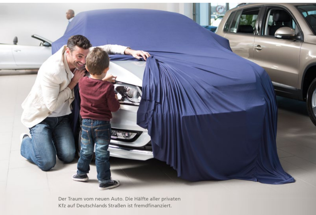
Der Traum vom neuen Auto. Die Hälfte aller privaten Kfz auf Deutschlands Straßen ist fremdfinanziert.

Sparen Sie beim neuen Auto nicht an der Versicherung. Eine gute Vollkaskoversicherung mit niedriger Selbstbeteiligung ist besonders bei finanzierten Fahrzeugen zu empfehlen. Damit sind Sie auch für den Fall der Fälle abgesichert.